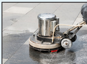
定期清掃 カーペット、WAX 他