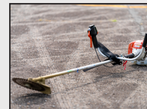
緑地管理 除草、剪定他