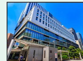
建築設備定期検査 特定建築物定期調査