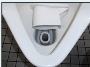
特別清掃 トイレリセット清掃他