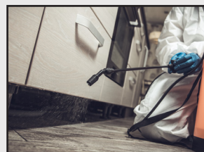
害虫、害獣防除 鳩、スズメ蜂対策