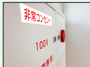
消防設備点検 防火対象物点検