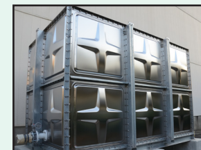
受水槽清掃 水質検査他