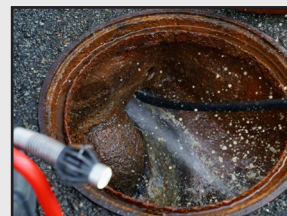
排水管洗浄 排水管カメラ診断