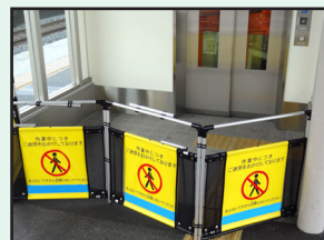
昇降機点検 機械式駐車場点検