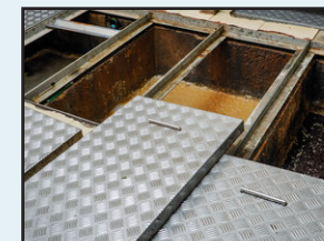
グリストラップ清掃