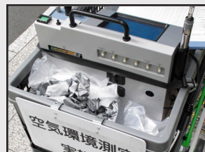
空気環境測定 各種測定業務