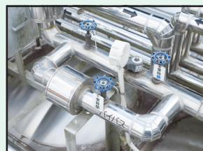
給水設備点検 ボイラー・ポンプ点検