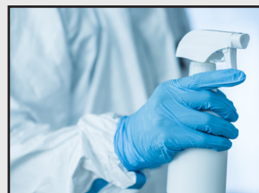
環境殺菌施工 各種コーティング他