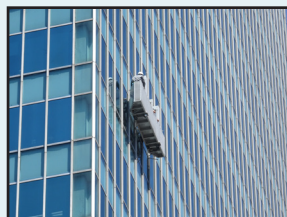
ガラス清掃 ブランコ、高所作業