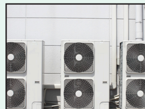
空調設備点検 フロン点検